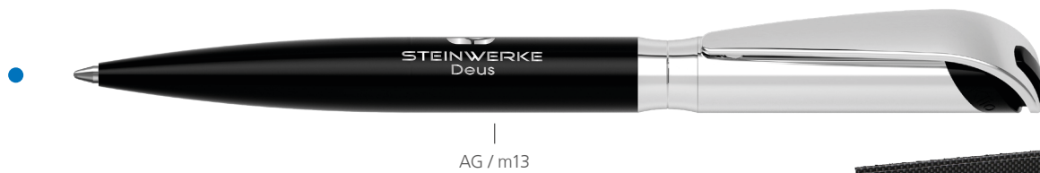
AG / m13