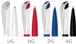
UG HG DG AG